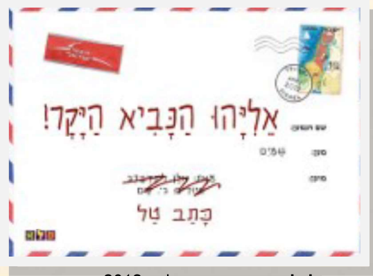
מאת אלן לינדברג, הוצאת פלא, 2012

ספר הילדים החדש "אליהו הנביא היקר!" נכתב כמכתבים, כאשר כל מכתב הוא סיפור בפני עצמו של ילד, המשתדל להשתנות ולהשתפר על מנת לקבל מתנות לחג מאליהו הנביא, אך כל פעם משהו אחר מרחיק אותו מהגשמת משאלותיו.