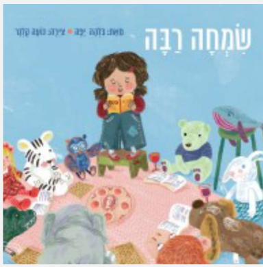
בוהצאת מזרחי מדיה, אפריל 2016

בכל שנה ילדי ישראל שרים בהתלהבות את השיר "שמחה רבה". הפעם רצינו להפנות את תשומת הלב לכך שמחצית מהשיר מוקדש לאליהו הנביא. אחד הרגעים הזכורים במשפחות רבות מליל הסדר הוא זה שבו הילדים רצים לפתוח את הדלת לאליהו הנביא. בעיניים בוהקות הם מכריזים: "הוא תכף יבוא. ממש עוד רגע", והמבוגרים בסדר קוראים ביחד "שלום אליהו!". "מה הוא כבר בא?! "תוהים הילדים. "כן", אומרים המבוגרים, "הוא צריך להספיק לבקר בכל הסדרים בעולם".