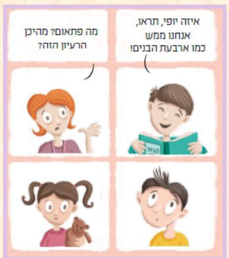
עמוד 47 בהגדה "כולנו מסובין"

הצורך לספר את הסיפור באופנים שונים נובע מכך שבני אדם לומדים ומבינים באופן שונה זה מזה, כפי שהדבר בא לידי ביטוי במדרש "כנגד ארבעה בנים דיברה תורה". מכיוון שעיקרו של ליל הסדר הוא סיפור ביציאת מצרים והעברת המסורת לדור הבא, קטע זה מדגים כיצד להתאים את הסיפור ביציאת מצרים לכל בן ולכל בת, לפי אופיים והבנתם. ההגדה מזכירה רק בנים, ולכן בימינו, עם המודעות לשוויון בין המינים, יש הגדות המוסיפות גם ארבע בנות.