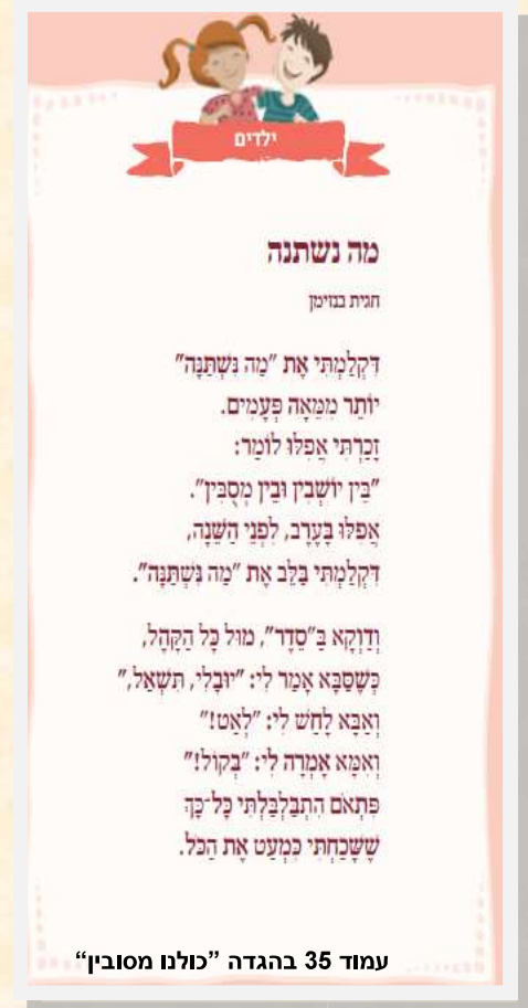
© כל הזכויות שמורות למחבר/ת ולאקו"ם

החבורות "עיניים" עוסקות אף הן בפיתוח שאלות פוריות במגוון נושאים ויכולות לשמש לך מקור להשראה.