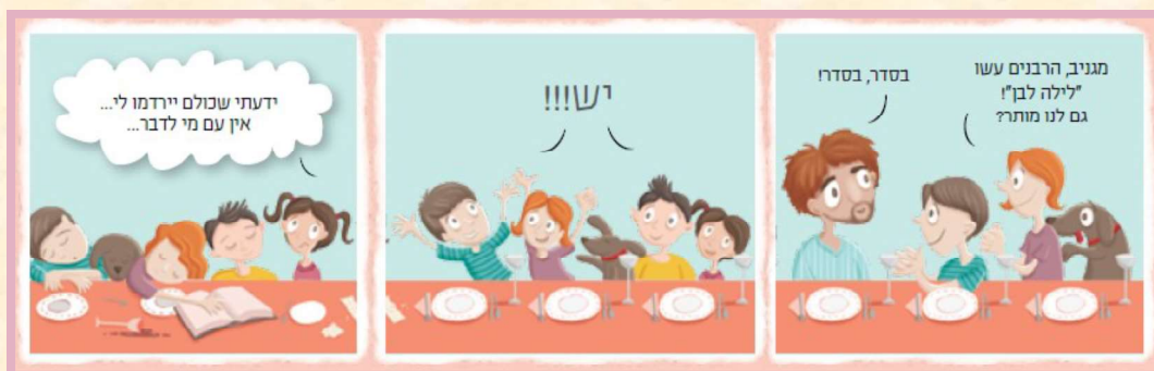
עמוד 45 בהגדה "כולנו מסובין"

הדוגמה בהגדה ללימוד חוזר היא הסיפור על חכמי ישראל שישבו בבני ברק וסיפרו ביציאת מצרים כל אותו הלילה. החכמים לא סיפרו את יציאת מצרים אלא סיפרו בה, כלומר למדו אותה. יש לזכור שהם התכנסו בבני ברק לאחר חורבן בית המקדש השני ולפני מרד בר כוכבא. החכמים האלה היו עדים לחורבן ולגלות וסבלו מגזרות השלטון הרומי בארץ ישראל. דורות אחרי יציאת מצרים הם עסקו בסוגיות של חופש וחירות. אך מדוע באו אליהם תלמידיהם עם שחר ולא למדו אתם כל הלילה? רוב הפרשנים סבורים שהתלמידים באו לשמוע מהם בשורה של שחר חדש. שחר חדש הוא ביטוי לתקווה ולשינוי. הלימוד והחיבור לסיפור העבר, בכוחם להוביל לדרך חדשה. מתוך הבנת העבר יש סיכוי לגלות דרך חדשה כדי להתמודד עם ההווה. חכמי הדור ידעו למצוא הסבר לכל תג בכל אות, ולכן אליהם פנו התלמידים.