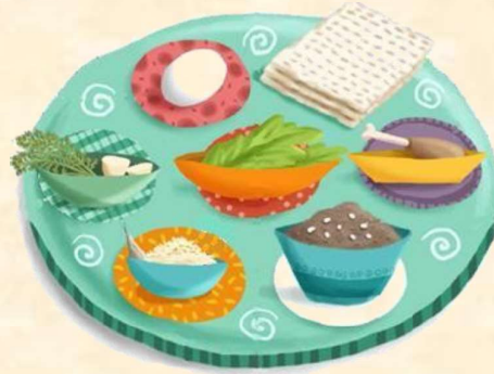
עמוד 12–13 בהגדה "כולנו מסובין"

החרוסת מזכירה את הטיט ששימש את בני ישראל בעבודת הפרך.