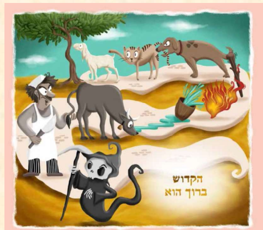
עמוד 133 בהגדה "כולנו מסובין"

אפשר לחבר עם הילדים שיר צביר על פסח, למשל: אני ילד שיוצא ממצרים ושם בתרמיל שלי חפצים - כל ילד אומר איזה חפץ וחוזר על החפץ שאמר חברו; כך נצברת רשימה של חפצים. אפשר גם לבקש מהילדים לכתוב סיפור או שיר צביר בסגנון של "אחד מי יודע" על מה שהם עשו בחופשת פסח (אחד ים כחול, שני סרטי קולנוע, שלושה טיולים וכן הלאה) או על מה שהם יעשו במתנה שקיבלו לחג. מומלץ להשתמש ברעיון בהקשרים אחרים: היה לי יום הולדת וקיבלתי מתנות; אני הולך לים ולוקח אתי חפצים, אנחנו עושים פיקניק וכל ילד מביא משהו; וכדומה.