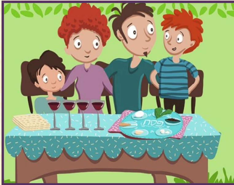
מתוך לוח השנה העברי, קרן תל"י

בשולחן הסדר אנחנו מעודדים את הילדים להיות "כוכבי הערב", ושאלותיהם זוכות ליחס של כבוד, כדי שהם יידעו, יזכרו ויעבירו את הסיפור ואת הזיכרון לדורות הבאים, על פי הנאמר בתורה: "והגדת לבנך ביום ההוא לאמור: בעבור זה עשה ה' לי בצאתי ממצרים" (ספר שמות, פרק י"ג, פסוק ח').