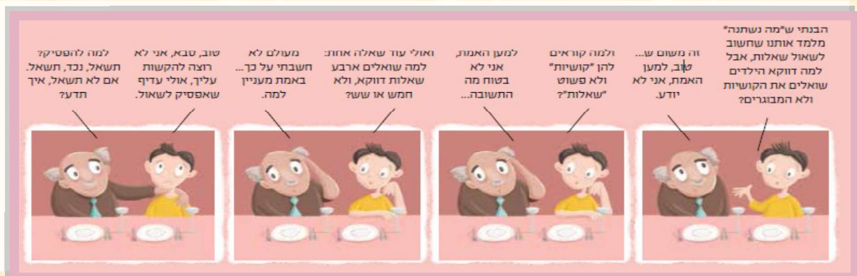
עמוד 35 בהגדה "כולנו מסובין"